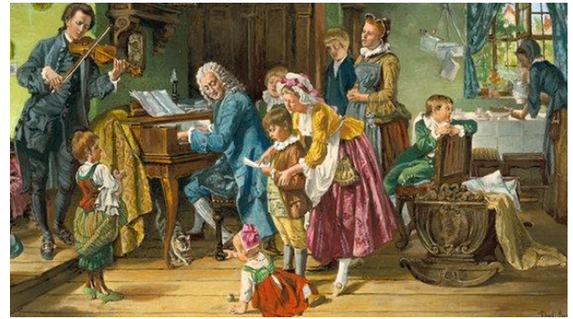
Johann Sebastian Bach mit Familie