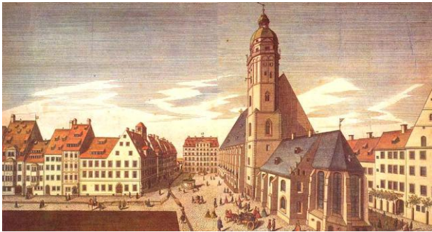
Die Thomaskirche (rechts) und die Thomasschule (Mitte hinten) in Leipzig im 18. Jahrhundert

Sebastian die junge Sängerin Anna Magdalena Wilcke. 1723 wurde er nach Leipzig berufen, an einen der angesehensten Musikerposten in Deutschland. Der Aufstieg vom Hofkapellmeister zum Kantor bedeutete neben einem hohen Prestige eine sichere berufliche Perspektive, aber ebenso den Verzicht auf weltliche Konzertmusik zugunsten der Kirchenmusik. Vor allem standen den Söhnen in der berühmten Universitätsstadt hervorragende Bildungsmöglichkeiten offen. Als akademische Grundlage für höhere Posten wurde das Fach Jura als empfehlenswert betrachtet.