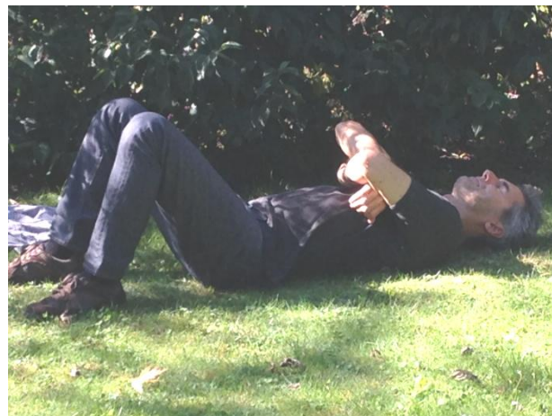
Auch bei unserem diesjährigen Programm wird KMK für so etwas wenig Zeit haben ...