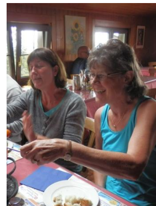
Eigentlich wollten wir nur kurz etwas trinken ...