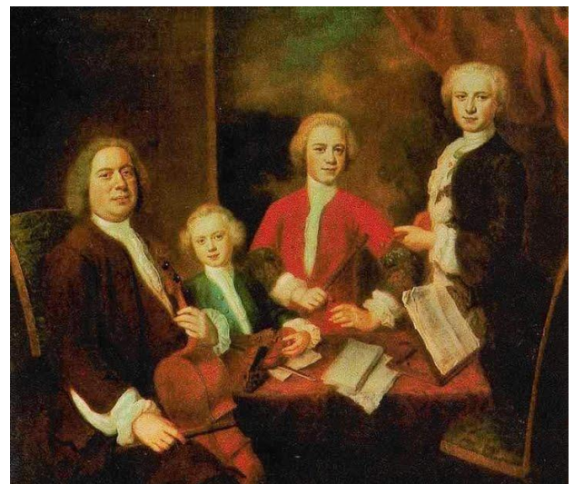
Johann Sebastian Bach mit seinen Söhnen

1731 beginnt C.P. Emanuel sein Jurastudium in Leipzig und veröffentlicht im ersten Schritt als Komponist das Menuet pour le clavecin . Bereits zwei Jahre später versucht er, als Berufsmusiker Fuss zu fassen und bewirbt sich – jedoch erfolglos – als Organist in Naumburg. Wegen den beengten Wohnverhältnissen der Familie Bach setzt er sein Jurastudium in Frankfurt/Oder fort. Er genießt die bisher ungekannte Freiheit und konzentriert sich mehr auf die Musik als auf sein Studium. Er erteilt Klavierunterricht und leitet ein studentisches Vokal- und Instrumentalensemble. Die ersten eigenen Kompositionen werden in dieser Zeit aufgeführt. Dabei wird der Generationsunterschied zum Vater deutlich: Johann Sebastian ordnete den Ausdrucksgehalt seiner Werke einer überpersönlichen Ästhetik unter, C.P. Emanuels Musik dagegen entspringt aus seinem Charakter. Der Künstler tritt nicht länger hinter dem Werk zurück, sondern gibt ihm durch den Ausdruck der eigenen Persönlichkeit das besondere Gepräge.