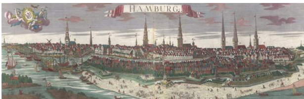
Ansicht von Hamburg im 18. Jahrhundert