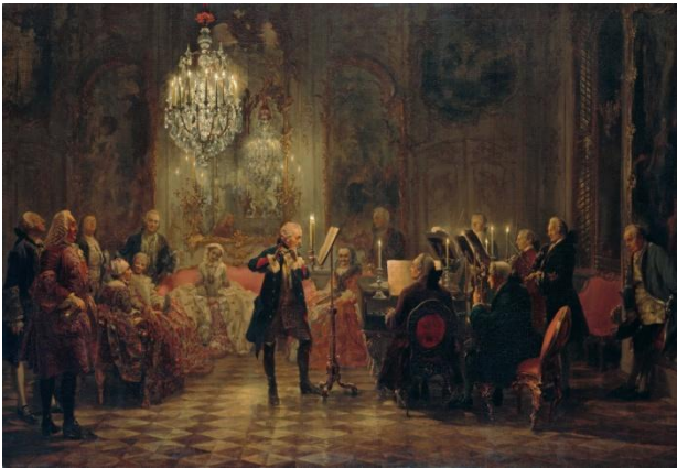
Adolph von Menzel: Das Flötenkonzert Friedrich des Grossen in Sanssouci

beim etwa gleichaltrigen Thronfolger, der sich gern mit Intellektuellen und Kunstkennern umgab. Obwohl wenig bekannt ist aus dieser Zeit, muss es ein inspirierender Lebensabschnitt gewesen sein, da der Musikliebhaber Friedrich selber Querflöte spielte und berühmte Virtuosen zu sich einlud. Daran erinnert das bekannte Gemälde Adolph Menzels, welches den König im Schloss Sanssouci inmitten seiner Musiker flötenspielend zeigt, am Hammerflügel begleitet von C.P. Emanuel Bach. Dem Maler lag allerdings kein Portrait von Bach vor, so entspringt das Aussehen des aufmerksam hinaufblickenden Tastenspielers gänzlich seiner Fantasie. C.P. Emanuel wird als untergesetzter, südländischer Typ beschrieben mit dunklen Augen, dunklem Teint und auffallend schwarzen Haaren, die er bis ins Alter behielt.