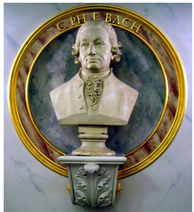
Büste Carl Philipp Emanuel Bachs im Schauspielhaus Berlin

Carl Philipp Emanuel Bach verdankte seinen Wohlstand zu einem grossen Teil seinem besonnenen Geschäftssinn. Die erfolgreichen Druckausgaben seiner Werke wurden nach dem Subskriptionsprinzip verkauft, wobei sich die eifrigen Besteller mit der Vorstellung schmeichelten, auf der «Pränumerantenliste» zusammen mit bekannten Komponisten, wichtigen Beamten oder Angehörigen des Hochadels zu figurieren. So dokumentieren diese Listen die Kenner und Liebhaber Bachs und weisen eine enorme geografische Spannweite auf: Neben den zentraleuropäischen Kulturzentren finden sich Orte wie St. Petersburg, Archangelsk, Cádiz und sogar das Kap der Guten Hoffnung. Aber ebenso trifft man unter den Vorbestellern auf Kaufleute, Bankiers, Glockenspieler, höhere Handwerker und Instrumentenbauer. Das legt nahe, dass Bach einem breiten Publikumsgeschmack gefolgt war und seine Musik sich neue Kreise des Bürgertums erschliessen konnte. So vermerkt Bach in seinen Aufzeichnungen: «Meine Sonaten und mein Heilig [Wq 217] gehen ab, wie warme Semlen, bey der Börse auf dem Naschmarkte, wo ich vordem mancher Mandel Pretzel den Hals gebrochen habe.»