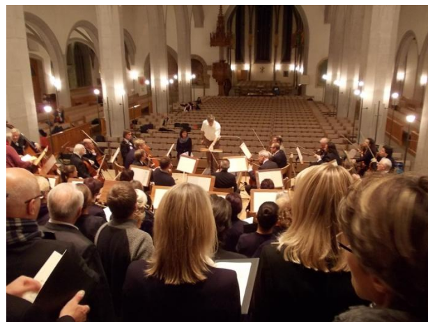
Die andere Perspektive ( vor dem Konzert, wohlgemerkt!)