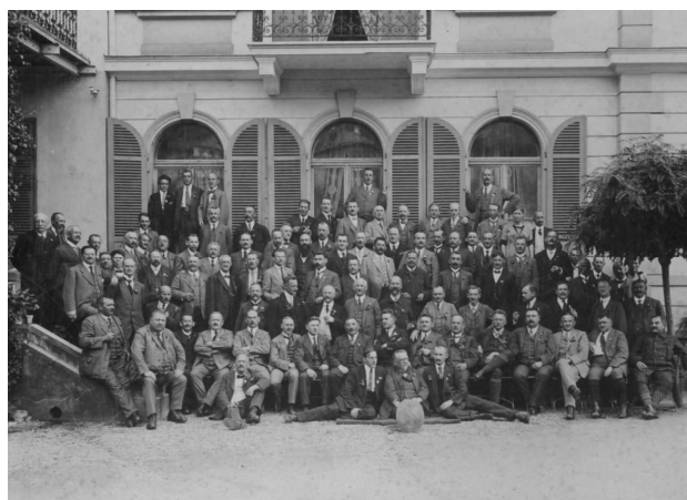
Männerchor Schaffhausen in Meiringen 1920 (Stadtarchiv SH)

dies stets ohne Murren, ohne Widerrede? Ich glaube schon, denn der Frauenchor erlebte einen jährlichen musikalischen Höhepunkt ohne jedes finanzielle Risiko, das selbstverständlich vom Männerchor allein getragen wurde. Ich glaube mich erinnern zu können, dass der Frauenchor sogar – sofern der finanzielle Erfolg es zuliess – eine kleine Summe als Dank grosszügig zugesprochen erhielt! Und natürlich wussten schon die Verantwortlichen des Männerchor mit welchen Werken damals (wie heute) die finanziellen Risiken klein waren. Und so sangen der Männerchor Schaffhausen und der brave Frauenchor Schaffhausen zur Freude der Musikinteressierten unserer Stadt und zur eigenen Genugtuung im Allgemeinen wohlgelungene Karfreitagskonzerte!