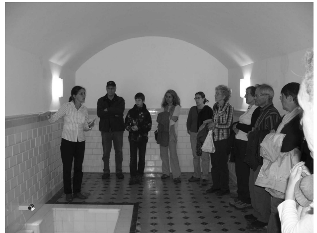
In der Mikwe

Mit der individuellen Besichtigung des Museums im Obergeschoss des jüdischen Schulhauses ging offizielle Teil des Anlasses zu Ende und mündete in den