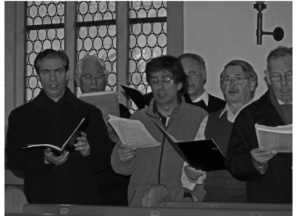
... an der ersten Stellprobe schon etwas geübter