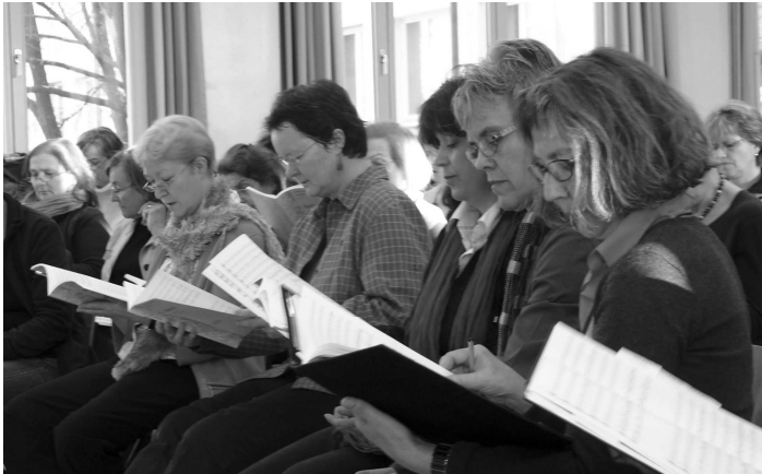
Am Anfang noch etwas suchend ...