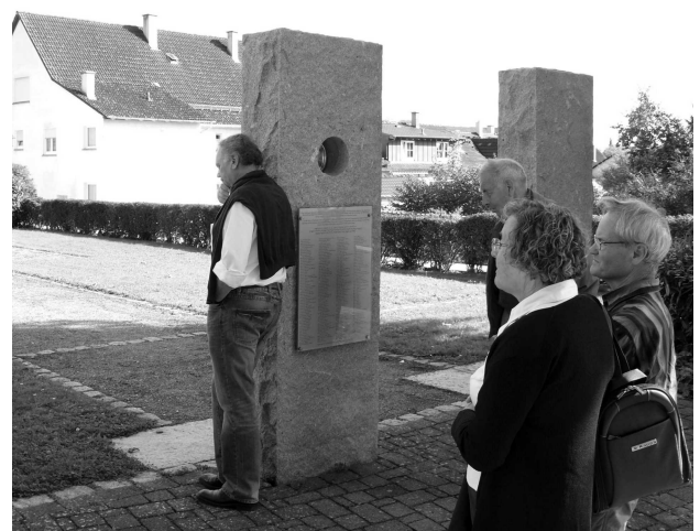
Stelen zeigen den Eingang zur zerstörten Synagoge

E-Mail: jued.geschichte.gailingen@t-online.de