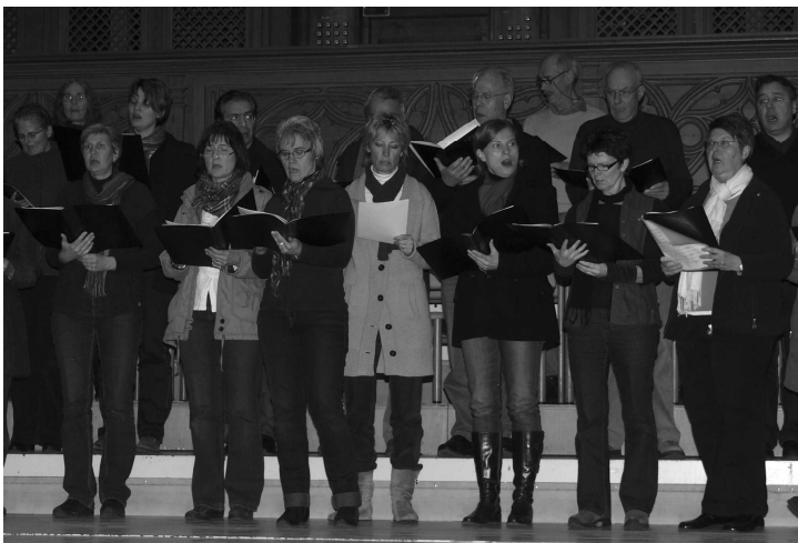
Stehen alle am rechten Ort?