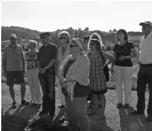
Warten auf den Beginn der Führung

Gäste aus Japan, die mit Kuonireisen beim Hopfenbauer halt machen, sollen dafür verantwortlich sein, dass die zum Bierbrauen verwendeten Chromstahlbecken ein Kupfermäntelchen bekommen haben. Die Japaner seien so fotosüchtig, dass es während seinen Vorträgen in der Braustube dauernd nur geblitzt habe. Damit die Bilder der Braubecken besser aussähen, sei er auf die Idee gekommen, diese mit einem Kupfermantel zu versehen.