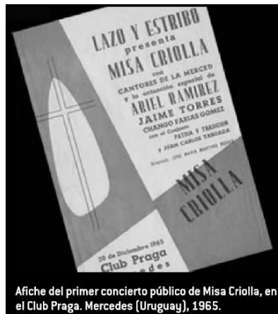
Afiche del primer concierto público de Misa Criolla, en el Club Praga, Mercedes (Uruguay), 1965.

1967 ging Ariel Ramírez auf Europatournee mit der «Misa Criolla». Die erste Aufführung der Messe fand in Würzburg statt. Nach Deutschland ging es weiter in die Niederlande, nach Belgien und in die Schweiz. Die Tour endete in Rom mit einer Ausstrahlung der Messe durch Radio Vatikan, und Ramírez überreichte Papst Paul VI. in einer Privataudienz eine Aufnahme.